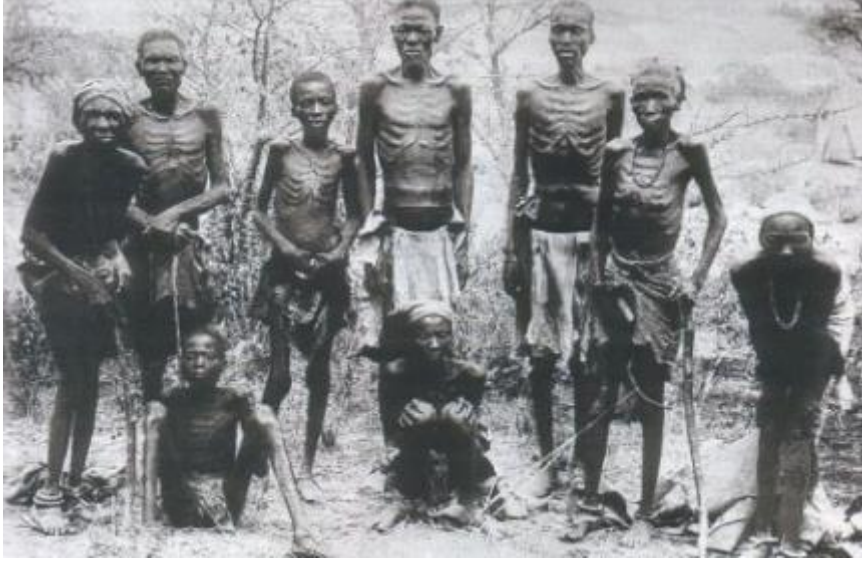
Ek: 2 – Tarih Ders Kitaplarımızda Yer Almayan, Almanlarca öldürülen Herero ve Namaka Halkları katledilmeden önce son resimleri , Afrika ,Namibia (1904)