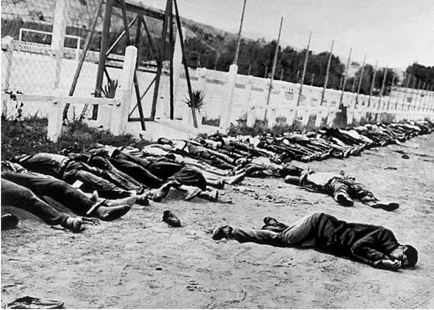
Ek :3- Tarih Ders Kitaplarımızda Yer Almayan, Fransız'ların Cezayir Soykırımı